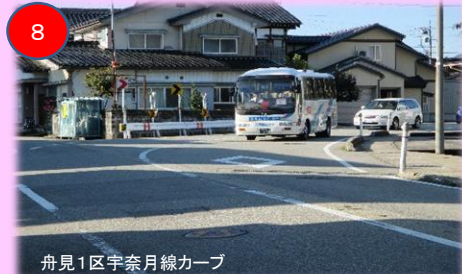
朝日、宇奈月線の郵便局方面の交差点