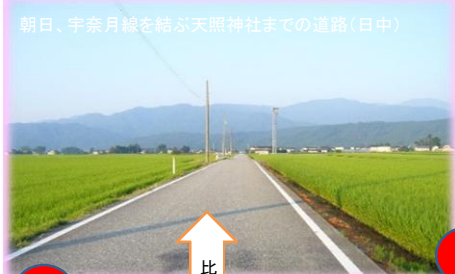
朝日、宇奈月線を結ぶ天照神社までの道路(日中)