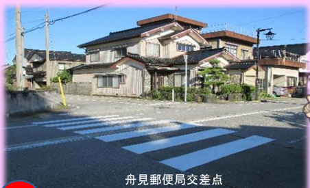
舟見郵便局交差点